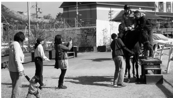
▲スタッフのサポートでひき馬乗馬を楽しむ様子

NPO法人 ホース・フレンズ事務局 ホース・フレンズ枚方セラピー牧場 住 所 〒573-1191 枚方市新町2-1 T E L : 072-841-1301 開場時間：10:00～16:00 定 休 日：月曜日、木曜日 U R L : http://www.horse-friends.org/